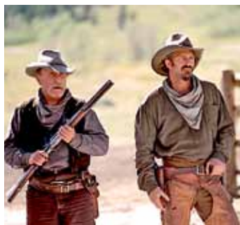
Boss (Robert Duvall) und Charley (Kevin Costner) sind wilde Cowboys.

Dieser Western ist eine Liebeserklärung an die scheinbare Unendlichkeit des amerikanischen Kontinents.