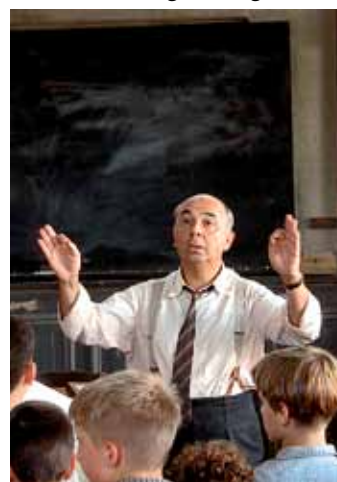
Mathieu (Gérard Jugnot) gründet mit seinen Schülern einen Chor.

Widerstand des Direktors (F. Berléand), der seine Schüler nur mit Prügel und Arrest traktiert, gründet Mathieu einen Chor und gewinnt bei den regelmäßigen Proben allmählich das Vertrauen seiner Schützlinge. Mit besonderer Hingabe widmet Mathieu sich dem jungen Pierre Morhange (J.-B. Maunier), dessen großes Talent er erkennt und mit viel Umsicht fördert. So ermutigt er auch Pierres alleinerziehende Mutter (M. Bunel), den Sohn aufs Konservatorium zu schicken. Doch dann geschieht ein furchtbares Unglück ... 90 Min. ▶ 15.25 2-015-570