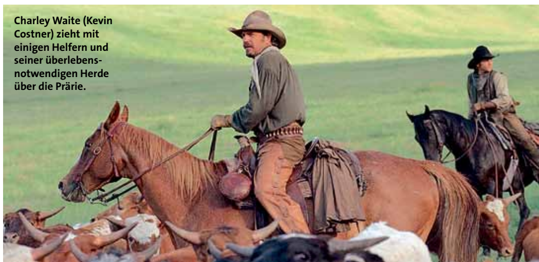
Charley Waite (Kevin Costner) zieht mit einigen Helfern und seiner überlebensnotwendigen Herde über die Prärie.

Dies ist dem reichen Rancher Denton Baxter (Michael Gambon) ein Dorn im Auge. Mithilfe korrupter Polizeieinheiten und durch wirtschaftlichen Druck versucht der Dorftyrann, den wilden Ranchern beizukommen ... Bei „Open Range – Weites Land“ führte Hauptdarsteller Kevin Costner zum dritten Mal Regie. Über den Film selbst sagte er einmal: „Für mich war das ein Stoff, den ich selbst gerne im Kino sehen würde. Wenn